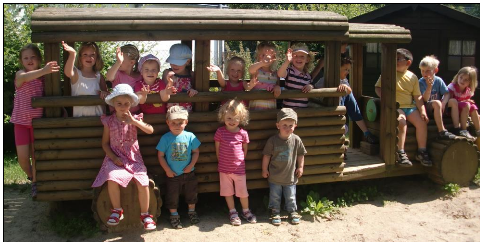
Städt. Kindertagesstätte Gelstertaler Spatzen – Hundelshausen Bachstraße 1 • 37215 Witzenhausen • Telefon 05542 - 4631

Dies ist nur ein kleiner Ausschnitt unseres Konzepts, deshalb würde es uns sehr freuen sie in unserem Kindergarten begrüßen zu dürfen, um sie noch mehr über unsere Einrichtung zu informieren.